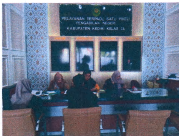
Gambar 2. Pelayanan pada tiap-tiap PTSP