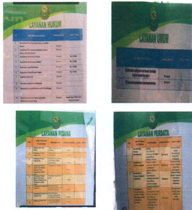
Gambar 1. Daftar Pelayanan Bagian PTSP